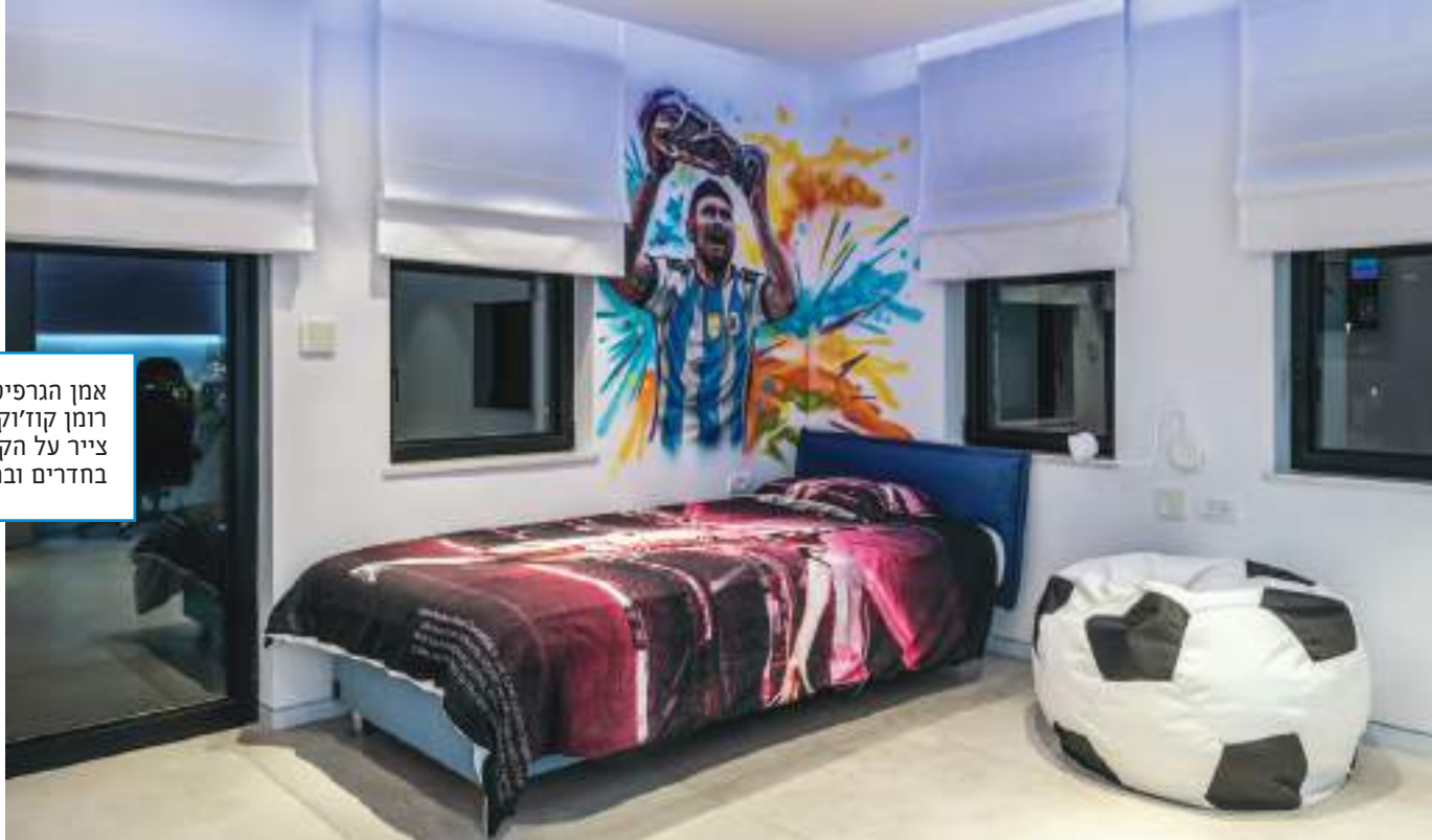
אמן הגרפיטי רומן קו'וקין צייר על הקירות בחדרים ובחצר

עוד אלמנט טכנולוגי הוא מסך לד בגודל 130 אינץ', כולל מערכת רמקולים, שמתאים למשפחה שאוהבת לצפות במשחקים ובאירועי ספורט. בחוץ יש גם מטבח לאירוח וכמה פינות